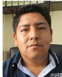
Rime Coro Responsable Sistema Impuestos